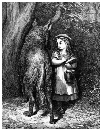
Le Petit Chaperon rouge dans la forêt, par Gustave Doré.

chaperon rouge tira la chevillette, et la porte s'ouvrit. Le loup, la voyant entrer, lui dit en se cachant dans le lit sous la couverture: "Mets la galette et le petit pot de beurre sur la huche, et viens te coucher avec moi." Le petit chaperon rouge se déshabille, et va se mettre dans le lit, où elle fut bien étonnée de voir comment sa mère-grand était faite en son déshabillé. Elle lui dit: "Ma mère-grand que vous avez de grands bras! – C'est pour mieux t'embrasser ma fille. – Ma mère-grand que vous avez de grandes jambes! – C'est pour mieux courir mon enfant. – Ma mère-grand que vous avez de grandes oreilles! – C'est pour mieux écouter mon enfant. – Ma mère-grand que vous avez de grands yeux! – C'est pour mieux voir mon enfant. – Ma mère-grand que vous avez de grandes dents! – C'est pour te manger". Et en disant ces mots, le méchant loup se jeta sur le petit chaperon rouge, et la mangea.