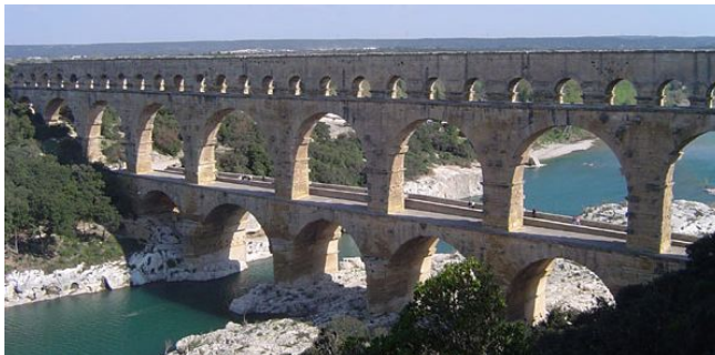
Pont de Gard, aqueduc romain (Wikipedia)